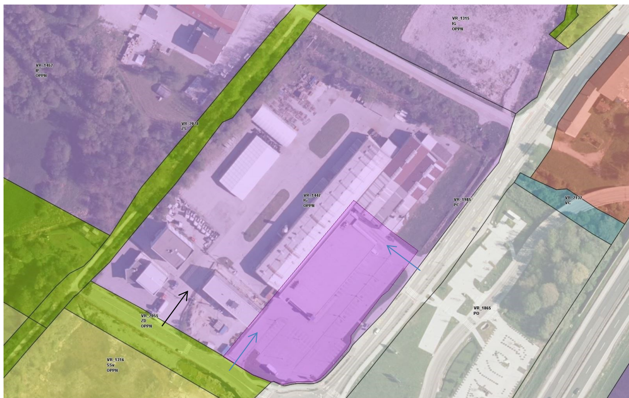
Slika 1: Izsek podrobne namenske rabe prostora iz OPN Občine Vrhnika z označenim območjem SD OPPN, ki je funkcionalno zaključena celota (modra puščica = uvoz na območje SD OPPN, ki se ne spreminja; črna puščica = obstoječi uvoz za preostali del območja veljavnega OPPN, ki zagotavlja dostop stavbam Kovinarske); iObčina, januar 2022.

SD OPPN se pripravijo za del območja veljavnega OPPN in sicer za območje stavbe Lidl-a s funkcionalnimi zemljišči. SD se pripravijo na pobudo investitorja – Lidl Slovenija d. o. o., k. d.