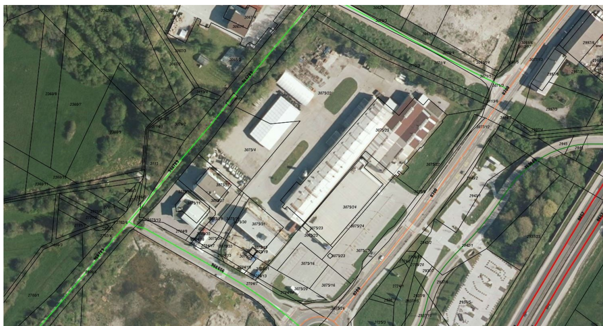
Slika 3: Javne ceste na območju SD OPPN in širše (javna pot 966656 – Cesta G; regionalna cesta 0300 – Brezovica – Vrhnika); iObčina, januar 2022.

Priključki na javno pot in regionalno cesto se s SD ne spreminjajo.